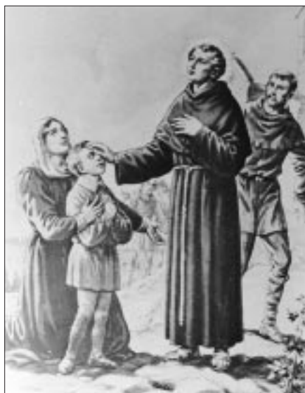
Blaženi Oton iz Pule liječi slijepog dječaka. Zavjetna slika u crkvi sv. Franje u Puli

Na osnovi malobrojnih autentičnih podataka o životu i djelovanju bl. Otona, pouzdano znamo da je živio u Puli, u prvoj polovici 13. stoljeća i da je bio jedan od prvih sinova sv. Franje Asiškog koji su, negdje u to doba, stigli u Istru. Predaja mu, osim "slave po izvanrednoj dobroti i savršenoj kreposti", pripisuje i četrnaest čudesnih ozdravljenja koja se kasnije potanko opisuju u djelima nekoliko crkvenih kroničara. Prema njima proizlazi da je, zahvaljujući svojim taumaturškim sposobnostima, bl. Oton iscijelio šest bolesnika koji su bolovali od oduzetosti, po dva od sljepoće i deformiranosti usta te po jednog od: grlobolje, nijemosti, slomljenih kostiju nakon pada i jednog uznemirenog od zloduha. Neka od tih čudesa blaženik je učinio za života, a druga, kao i mnoga nezabilježena, nastavila su se događati na