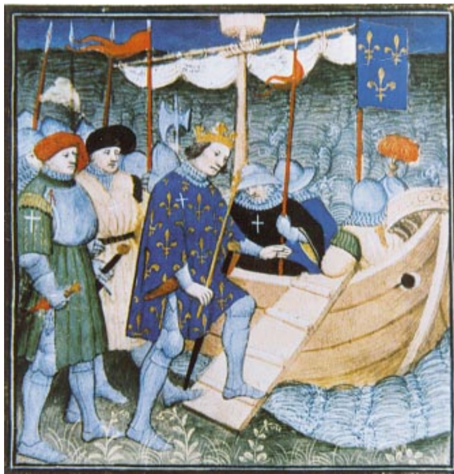
Ljudevit IX. polazi u križarski rat. Minijatura iz 15. stoljeća

Nakon što je u tridesetoj godini ozdravio od neke teške bolesti, zavjetovao se da će krenuti u oslobađanje Svetoga groba te s tom nakanom godine 1248. kreće u tzv. Šesti križarski rat. No, stigavši u Svetu zemlju, nakon prvih uspjeha sreća mu okreće leđa. Najprije mu kuga i glad desetkuju vojsku, a zatim, 1250. kod Mansuratha doživljava teški poraz, nakon čega skupa sa svojim vitezovima pada u zatočeništvo. Tu obolijeva od teške dizenterije i jedva živ dočekuje veliku otkupninu. Na povratku u Francusku donosi i jednu od najčuvanijih relikvija - trnovu krunu za koju se vjerovalo da je Kristova i česticu Isusova križa, što će kasnije biti pohranjeno u znamenitoj