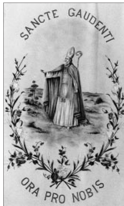
Sv. Gaudenc na zastavi katedrale u Osoru

Po predaji, rođen je kao Petar Gaudencije, krajem 10. stoljeća, u zaseoku Tržić u blizini Osora na otoku Lošinju. Pristupivši benediktincima, ističe se pobožnošću i marljivošću te će uskoro na svom otoku osnovati benediktinski samostan i postati njegovim opatom. Nemalo zatim, 1024. biva izabran za biskupa u Osoru te se prihvaća nimalo lakog zadatka: uvođenja reda među svećenicima i redovnicima te suzbijanja nemoralna u puku i među vlastelom. Pritom se posebno okomio na razmjerno česte brakove srodnika, što će mu priskrbiti neugodnosti te će na kraju biti prisiljen napustiti grad. Put ga vodi do pape koji mu daje podršku te se Gaudencije zadovoljan uputi kući. Iscrpljen i bolestan, putem se nakratko zaustavlja u benediktinskom samostanu u Porto Nuovo kraj Ankone, gdje mu se zdravstveno stanje naglo pogoršava te u visokoj vrućici umire 31. svibnja 1044. Kasnije su njegovi zemni ostaci preneseni u